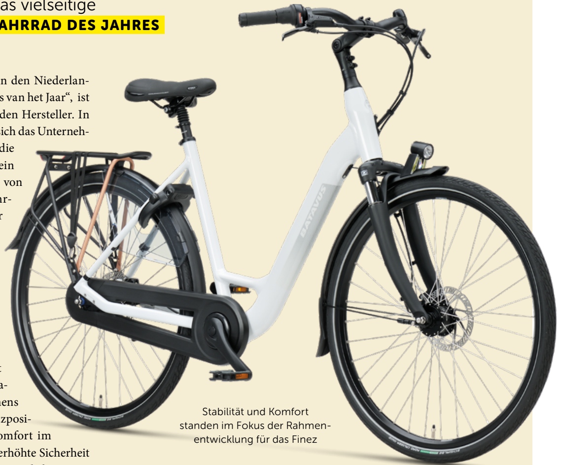
Stabilität und Komfort standen im Fokus der Rahmenentwicklung für das Finez

Bei der Bewertung konzentriert sich die Fachjury der Bicycle Awards auf verschiedene Aspekte, etwa Innovation, Fahrverhalten und Komfort, Sicherheit, Materialien, Design und Preis-Leistungs-Verhältnis. Die unabhängige Jury setzt sich aus Redakteuren des Tweewielers, NieuwsFiets.nu, Fiets und ANWB Media sowie dem RAI-Verband, Radexperten und einem Designer zusammen.