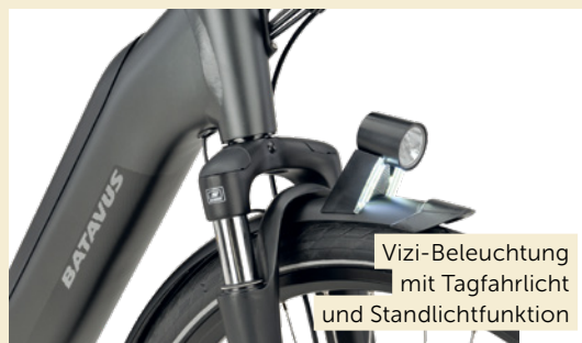
Vizi-Beleuchtung mit Tagfahrlicht und Standlichtfunktion