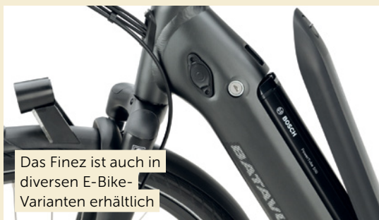
Das Finez ist auch in diversen E-Bike-Varianten erhältlich

Rahmen: Trapezrahmen schwarz oder weiß, Diamantrahmen schwarz, RH 48, 53, 57, 61, 65 cm; Rahmenmaterial: Aluminium; Bremsen: Hydraulische Scheibenbremse; Schaltung: Nexus 7-Gang; Ausstattung: Nabendynamo, Kunststoff-Schutzblech, Schwalbe-Reifen, Batavus Vizi-Beleuchtung (vorne mit Tagfahrlicht), gefederte Sattelstütze, Aerflow Federgabel; Gewicht: 21 kg; Preis: ab 899 Euro